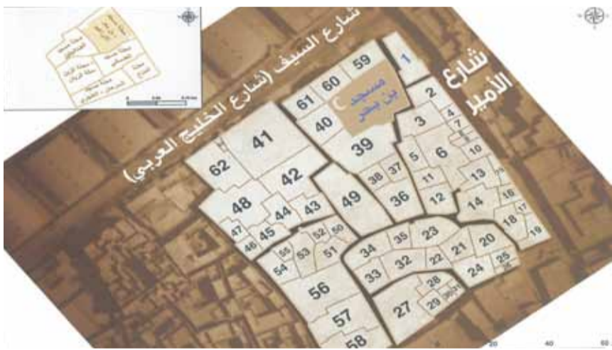
خريطة توضح قسائم محلة مسجد ابن بحر - الإبراهيم

■ الدروازه: هي البوابة الكبيرة التي تتسع لمرور قوافل الجمال والسيارات والشاحنات، وهي كلمة هندية أو فارسية، ويرى البعض أن الأصل فيها Door Ways أي باب العبور، وكان الانكليز يطلقونها في الهند على البوابات الكبيرة، وقد استخدم الكويتيون كلمة «دروازه» للدلالة على بوابات السور الكبيرة.