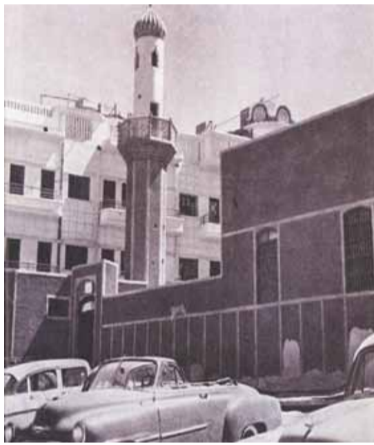
مسجد العبدالجليل الذي جددت دائرة الأوقاف بناءه بتاريخ 1/17/1953م

تنسب هذه المحلة إلى أحد المساجد القديمة في الكويت، وهو مسجد العبدالجليل الذي أسسه ثاني قضاة الكويت الشيخ أحمد بن عبدالله بن عبد الجليل سنة 1779م، وقيل قبل ذلك، وقد تولى القضاء بعد وفاة الشيخ محمد بن فيروز (أول قاض عرف في الكويت سنة 1135 هـ الموافق 1722م، واستمر في القضاء حتى عام 1170 هـ - 1756م)، حيث تنازل عنه للشيخ محمد بن عبد الرحمن العدساني، وقد اشتهر المسجد عند المتأخرين باسم مسجد «مسعود» نسبة إلى الملا مسعود الههقي الذي كان إمامه ومؤذنه، وقد تم هدم المسجد في أوائل الستينيات وبناء مسجد آخر باسم المؤسس في منطقة الفيحاء. وقد اشتهرت هذه المحلة عند الكثير من كبار السن في ذلك الوقت باسم «فريح غنيم».