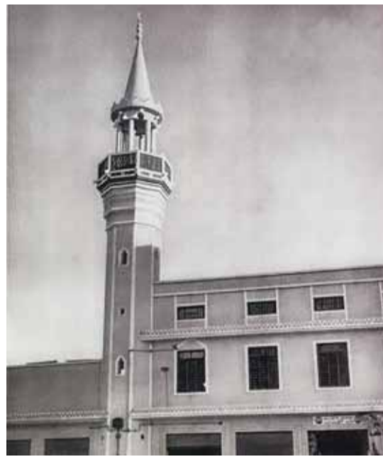
نظراً لأقدم مسجد ابن بحر لا يمكن الجزم بتاريخ تأسيسه

اشتهرت محلة مسجد ابن بحر (الإبراهيم) (نسبتها إلى أقدم مسجد عرف في الكويت، ونظراً لقدمه فلا يمكن الجزم بتاريخ تأسيسه أو تحديد مؤسسه على وجه الدقة، فهناك من يرى أن مؤسسه من أسرة الإبراهيم لقرية من بيوتهم، ومنهم من يرى أن مؤسسه هو إبراهيم بن عبدالله بن بحر، وجدد بناءه) التجديد الأول (عبدالله بن علي بن سعيد بن بحر بن خميس بن ثاني بن خميس بن وسيط بن معن سنة 1158 هـ 1745م)، (طبقاً للوثيقة الخاصة به، ثم جدد بناءه) التجديد الثاني (عبدالله بن عيسى بن علي بن إبراهيم سنة 1275 هـ 1858 م)، (ويحتمل أن يكون تاريخ تأسيسه بين عامي 1080 هـ - 1098 هـ و 1669م - 1685م)، وقد تم هدم المسجد في فترة الستينيات.