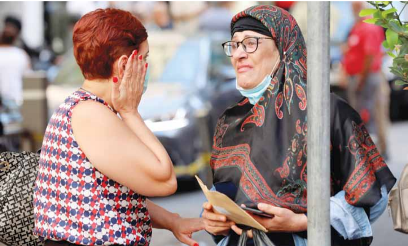
امرأتان متفاعلتين غضباً خارج المركز الطبي للجامعة الأميركية في بيروت بعد صرفهما من عملهما

وفي شأن مشروع الحياد الذي استدعى زيارته إلى الديمان بطوافه عسكرية، فقد جاء موقف