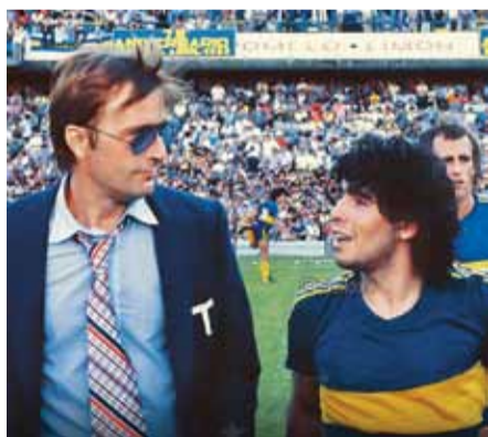
مارادونا ومارسوليني إبان وجودهما في بوكا جونيورز

وعاد مارسوليني للإشراف على بوكا جونيورز في 1995، في آخر تجربة له في الإدارة الفنية لفريق في الدرجة الأولى.