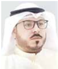
عبد الكريم المجهول

وهذا ما تعبر عنه مواقع التواصل الاجتماعي والدواوين والمنديات، نرى أن الشيخ ناصر أعاد الهيبية لحملة محاربة الفساد، كما أعاد الهيبية للكثير من الأمور التي أصابها ما أصابها على يد قلة منحرفة أوغلت في التعدي على المال العام. كتبتهما سابقاً وأكرهها اليوم بوعبدالله قد تكون خسرت بعض المناصب الإدارية ولكنك حزت محبة الأغلبية الساحقة من الشعب الكويتي واحترامها. فهل وصلت الرسالة؟.. أمل ذلك.