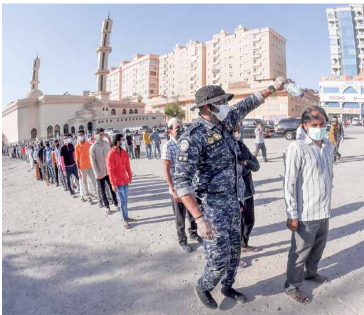
أحد أفراد القوات الخاصة يخفف الحرارة عن أحد العمال

ولمس العديد من رواد المساجد وجود رجال القوات الخاصة مع بداية عود المساجد لصلاة الجمعة، حيث أشرفوا على تنظيم دخول وخروج المصلين وضمان حمايتهم وتطبيق الشروط والأنظمة من دون أي خلل أمني أو إجرائي.