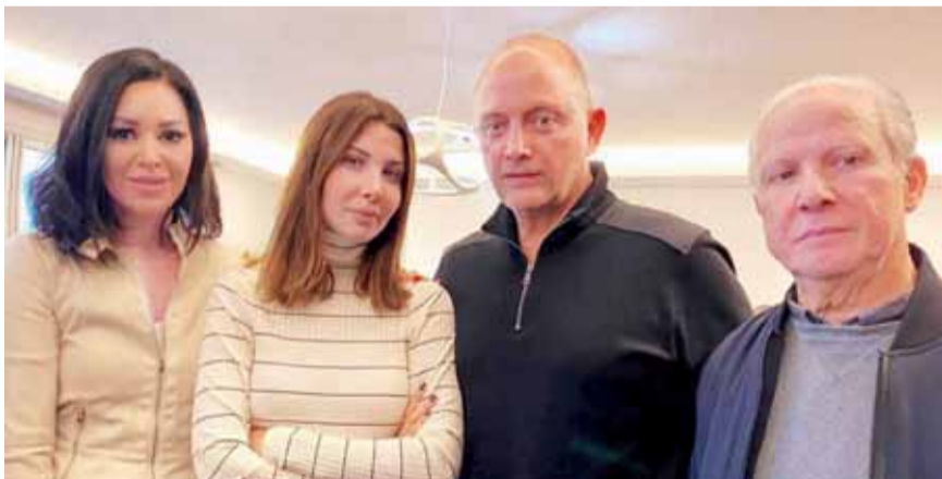
نانسي عجرم مع أسرتها

انقسم رواد مواقع التواصل الاجتماعي ما بين مؤيد ومعارض للفنانة اللبنانية نانسي عجرم وزوجها الدكتور فادي الهاشم، وذلك بعدما بثت منصة «شاهد vip» فيلم «الرواية الكاملة»، الذي تناول حادثة تعرض منزل نانسي للاقتحام وما ترتب على ذلك من مصرع الشاب السوري محمد الموسى على يد زوج الفنانة اللبنانية. الفيلم الوثائقي كشف تفاصيل اقتحام فيلا الفنانة اللبنانية نانسي عجرم، وأسباب قيام زوجها فادي الهاشم بإطلاق 18 رصاصة على المتهم باقتحام الفيلا، وأشعل الفيلم الخلاف بين رواد مواقع التواصل، هناك من أبدى تعاطفاً مع نانسي وأسرتها، بينما تضامن آخرون مع القاتل وشككوا في مصداقية «الرواية الكاملة».