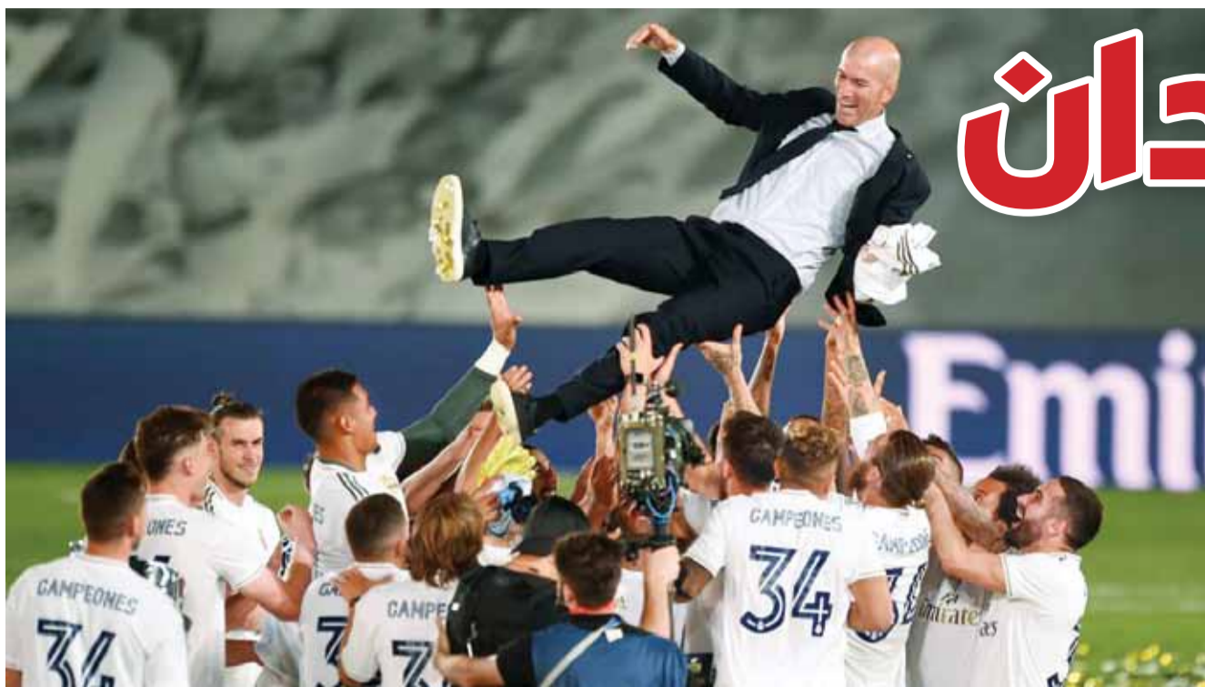
زيدان محمولاً على أكتاف لاعبي ريال مدريد بعد إحراز اللقب الـ 34

أعلن الألماني توماس باخ رئيس اللجنة الأولمبية الدولية منذ 2013، في افتتاح الجمعية العمومية الـ 136، معترفاً بأنه لا يوجد اليوم «حل» واضح لألعاب طوكيو العام المقبل في وقت تضرت فيه الحركة الأولمبية بشدة من فيروس كورونا المستجد. وقال باخ (66 عاماً) في افتتاح الجمعية العمومية الـ 136 للجنة الأولمبية الدولية والتي عقدت عبر الفيديو «في السنوات الأخيرة سألني الكثير منكم حول انتخاب رئيسي العام المقبل. أنا ممتن ومثابر بشدة من كلمات التشجيع والثقة.. إذا أردت ذلك، انضم أعضاء اللجنة الدولية، فانا مستعد لولاية جديدة لرئاسة اللجنة الأولمبية الدولية، من أجل الاستمرار في خدمتكم وخدمة الحركة الأولمبية التي نحب كثيرًا، لأربع سنوات إضافية». وخلف باخ (66 عاماً) البلجيكي جاك روغ في 2013 لولاية مدتها ثماني سنوات. وسيترشح لفترة ثانية وأخيرة مدتها أربع سنوات عام 2021 (ينتخب رؤساء اللجنة الأولمبية الدولية لمدة ثماني سنوات تجدد مرة واحدة لمدة أربع سنوات). ويبدو الكندي ديك باوند المنافس الوحيد لباخ الذي سيستفيد من