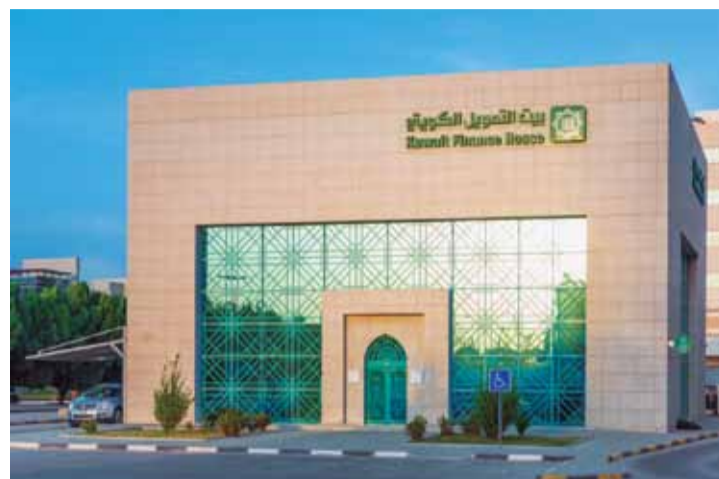
أحد فروع «بيتك»

امتثالاً لقرار مجلس الوزراء بشأن الاعتداد بالبطاقة المدنية الرقمية للتعريف بهوية الأشخاص وإنجاز المعاملات، وضمن جهوده المتميزة في التحول الرقمي، أعلن بيت التمويل الكويتي (بيتك)، اعتماد البطاقة المدنية الرقمية عبر تطبيق «هويتي» كإثبات رسمي للعملاء، مما يتيح لهم إمكانية إنجاز معاملاتهم المصرفية بكل سهولة. وتأتي هذه المبادرة ضمن الالتزام بالتوجهات الحكومية، كما هي في إطار جهود «بيتك» في تعزيز ريادته في التحول الرقمي للصناعة المصرفية، من خلال تبني ومواكبة آخر وأحدث خدمات التكنولوجيا المالية والتطبيقات الرقمية، وتطبيق الذكاء الاصطناعي وتكنولوجيا البلوكتشين في العمليات التشغيلية ضمن مهنية عالية ومعايير عالمية، بنهج عميل تجربة مصرفية فريدة ومميزة. ويعد تطبيق «هويتي» المنحاح عبر الموبايل، واحداً من أهم التطبيقات الحكومية التي تشهد إقبالاً كبيراً من المستخدمين الراغبين بالحصول على بطاقة مدنية رقمية، حيث يستقبل «بيتك» العملاء لإنجاز معاملاتهم المصرفية عبر هذه البطاقة بما يضمن سهولة الإجراءات.