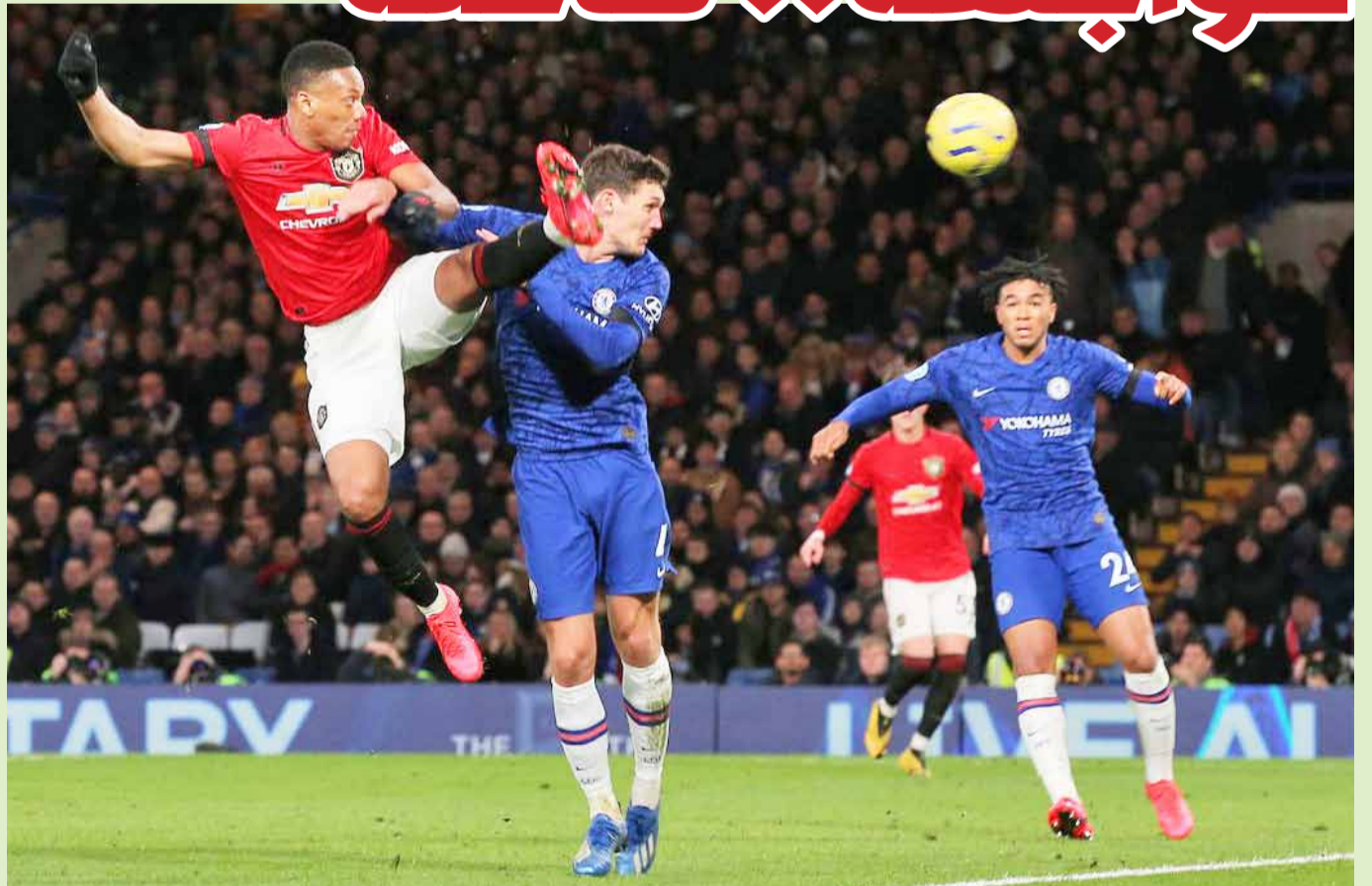
مارسيلال نجم يونبايتد (اليسار) خلال لقاء فريقه أمام تشلسي في لقاء سابق

يفتح ملعب ويمبلي الشهير مدرجاته الخالية من الجماهير أمام مباراة نصف نهائي كأس إنكلترا لكرة القدم، اليوم بين مانشستر يونايتد وتشلسي، في مواجهة قوية. يسعى مانشستر يونايتد المتوج 12 مرة آخرها في 2016 إلى تحقيق فوزه الرابع تواليًا هذا الموسم على تشلسي حامل اللقب ثماني مرات آخرها في 2018. وفاز رجال المدرب النرويجي اولي