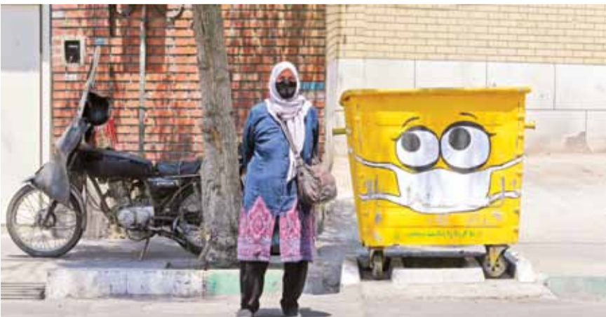
إيرانية بجانب صندوق قمامة رسم عليه كمام في حملة لنشر الوعي حول الوباء

الولايات المتحدة التي يوجد فيها أكثر من 3.6 ملايين حالة إصابة مؤكدة - لا تزال تشهد قفزات يومية ضخمة، متجاوزة 77 ألف حالة إصابة جديدة في اليوم، وأعلنت إحدى مقاطعات ولاية تكساس عن إصابة 85 رضيعاً بفيروس كورونا المستجد، وفق ما نقلت شبكة «سي إن إن». وقالت الشبكة إن مقاطعة نوبسيس في تكساس شهدت ارتفاعاً حاداً في عدد حالات الإصابة