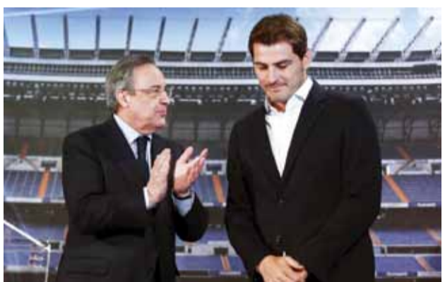
كاسياس وبيريز. الشغل التأم مجدداً

سيعود حارس الرمي السابق إيكو كاسياس إلى ناديه ريال مدريد المتوج هذا الموسم بلقب الدوري الإسباني لكرة القدم، ليحل محل منصباً استشارياً لرئيسه فلورنتينو بيريز، بحسب ما أفادت تقارير صحافية محلية. وأوضحت التقارير، ومنها لصحيفة «ماركا» المديرية والخدمة الإسبانية لشبكة «إي أس بي إن»، أن المفاوضات بين القائد السابق للفريق وإدارة النادي بلغت مراحل متقدمة، ويرجع أن يكون في منصبه السابق مع انطلاق موسم 2020/2021 في سبتمبر. ونشأ كاسياس (39 عاماً) في صفوف ريال، وأمضى معه نحو 25 عاماً، دافع في 16 منها عن الفريق الأول، قبل انتقاله في 2015 إلى بورتو البرتغالي. وأصبح كاسياس ضمن الأسماء الأسطورية في تاريخ القلعة البيضاء. ويصف الموقع الإلكتروني