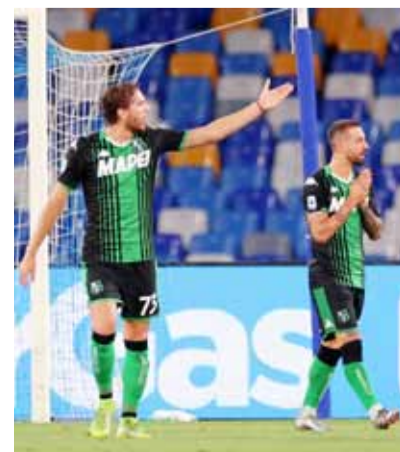
لاعبا ساسولو معترضين على قرارات الحكم

شهدت احتفالات نادي زينيت سانت بطرسبرغ بلقب كأس روسيا لكرة القدم، بعد فوزه على منافسه خيمكي، في المواجهة النهائية التي جمعت بينهما بهدف مقابل لا شيء، حادثة غريبة كان يطلها النجم الصربي برانسلاف إيفانوفيتش. وبعد انتهاء الوقت الأصلي من عمر المواجهة النهائية في كأس روسيا لكرة القدم، سارعت اللجنة المنظمة للمباراة، والمتواجدة في أرض الملعب إلى تجهيز منصة البطولة، كي يحتفل نجوم نادي زينيت سانت بطرسبرغ باللقب للمرة