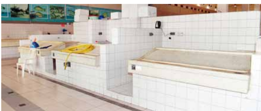
بسطات مرخصة بلا نشاط

وعن الأسعار في السوق بينوا أنها كما تعلن عنها وزارة التجارة، حيث تتراوح أسعار الزبيدي المستورد بين 6.500 فلس و7 دنانير للكيلو الواحد أما الكويتي فيصل إلى 12 ديناراً. وأكدوا أنهم يستغلون تواجدهم في السوق لممارسة نشاطهم والبيع من خلال تطبيقات التواصل الاجتماعي والأونلاين ويتم توصيل الطلبات للمنازل وحسب الرغبات، وأن البيع الإلكتروني أفضل بكثير من انتظار قدوم الزبائن لهم. أما باعة سوق الخضار فذكروا أن مبيعاتهم للأسف شحبة منذ أزمة كورونا والاعتماد على شراء المواد منهم الآن بات معدوماً، لكن هناك محاولات للتسويق الإلكتروني لها، حيث إن الأسعار مميزة وأرخص من الأسواق المماثلة.