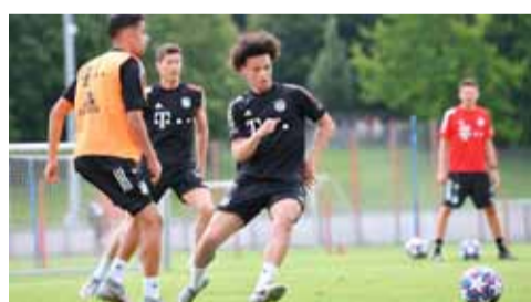
ساني الوافد الجديد خلال تدريبات بايرن

ويستضيف بايرن فريق تشلسي الإنجليزي في إياب دور الستة عشر لدوري الأبطال يوم الثامن من أغسطس بعد أن حسم مباراة الذهاب التي جرت في فبراير بثلاثية بيضاء.