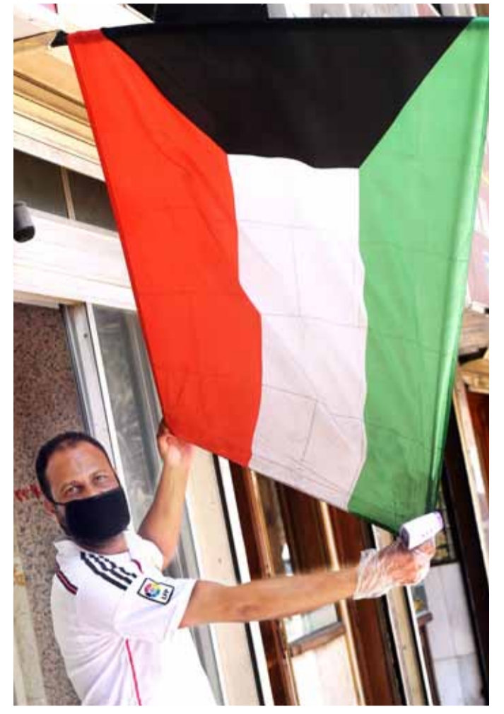
مقيم يرفع علم الكويت