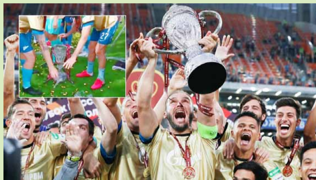
إيفانوفيتش حاملاً الكأس.. وفي الإطار لحظة سقوطه

قال فاييو كابيللو المدرب الأسبق لريال مدريد بطل الدوري الإسباني لكرة القدم إن إيدن هازارد عانى كثيراً من أجل الوصول لمستوى التوقعات الكبيرة التي كانت منتظرة منه عقب انتقاله إلى النادي الملكي قادماً من تشلسي الإنجليزي في العام الماضي. وقال هازارد تشلسي للفوز بلقب الدوري الإنجليزي مرتين خلال وجوده في ستامفورد بريدج، لكنه فشل في تحقيق إنجازات مماثلة في العاصمة الإسبانية بعد أن تعثرت مسيرته بسبب الإصابات التي تقلصت بسببها مشاركته إلى 21 مباراة فقط. وقال كابيللو لصحيفة ماركا الإسبانية «لم يكن نفس اللاعب الذي كان في تشلسي وتعرض لإصابات لمدة طويلة.. لم يندمج تماماً (في أسبانيا)». وأضاف «داننا كنت اعتبره لاعباً كبيراً، لكن مسؤولية اللعب في ريال ثقيلة، وتعثر هازارد تحت وطأة هذا العبء، هذا الموسم. بالتأكيد سيكون أفضل في الموسم المقبل».