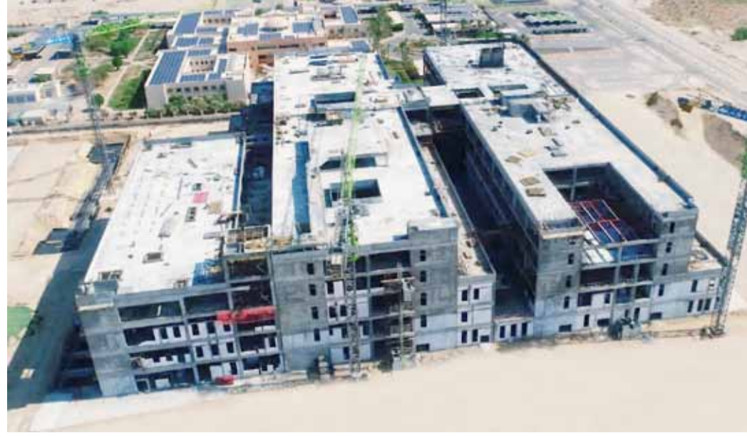
جانب من عمليات الإنشاء والبناء في أحد مستشفيات «ضمان»

■ الرشدان: نتابع تطبيق الاشتراطات الصحية في المواقع الإنشائية