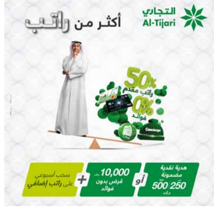
ملصق حملة «أكثر من راتب»