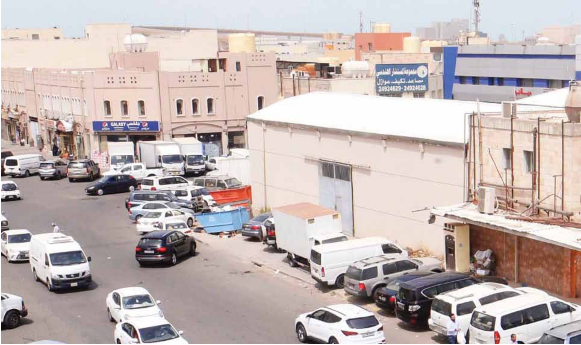
هل يتعش قطاع المخازن مع عودة الحياة والفتح التدريجي؟

الشويخ والري في الصدارة.. والتخزين الغذائي الأعلى سعراً