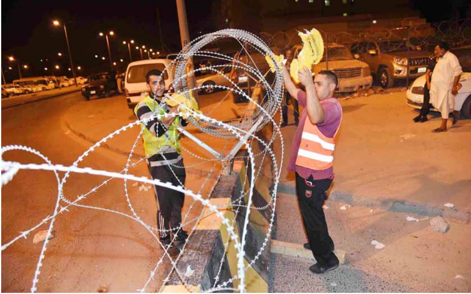
عمالة «الأشغال» أثناء فك الأسلاك