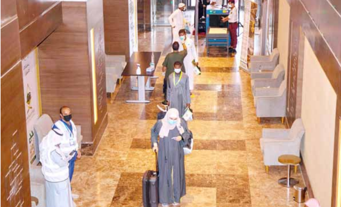
عامل طبي مرتدياً كماماً يتحقق من درجة حرارة أجسام الحجاج الوافدين في فندق بمكة المكرمة

أعلنت السعودية بدء توافد حجاج بيت الله الحرام على مكة، قبيل أيام من بدء مناسك حج محدود، وسط إجراءات احترازية بسبب «كورونا». ويُعد ذلك أول إعلان لوصول وفود حجاج مكة، في ظل قرار سابق للمملكة بتنفيذ حج محدود لبضعة آلاف من المقيمين، تفادياً لتداعيات تفشي الفيروس. وتتوقع السعودية أن يكون عدد الحجاج أقل من 10 آلاف حاج، ولن هم أقل من 65 عاماً، ولا يعانون من أمراض مزمنة. وأكدت وزارة الداخلية أنها فرضت طوقاً أمنياً محكماً على المشاعر المقدسة، محذرة من القيام بالحج دون تصريح مسبق. وأوضح أنها ضبعت خلال أسبوع 16 شخصاً مخالفاً. والثلاثاء، أعلنت السعودية خططها لتنفيذ إقامة الحج المحدود للمقيمين في أراضيها، عبر وسائل عدة، أبرزها إقامة الطواف بأفواج ويمسافات آمنة، وتخفيف عمليات التعقيم والتطهير لتصل إلى 10 مرات في اليوم، وتجنيب 3500 عامل يعملون على 3 ورديات، (واس)