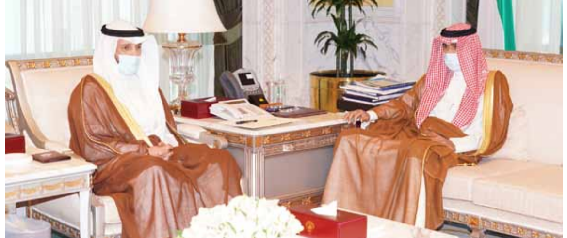
نائب الأمير خلال استقباله الغانم

رئيس مجلس الوزراء الشيخ صباح الخالد برد الاقتراح بقانون بشأن تعديل قانون المرافعات المدنية والتجارية (قانون مخصصة القضاة وأعضاء النيابة العامة) وذلك وفقاً للمادة 66 من الدستور.