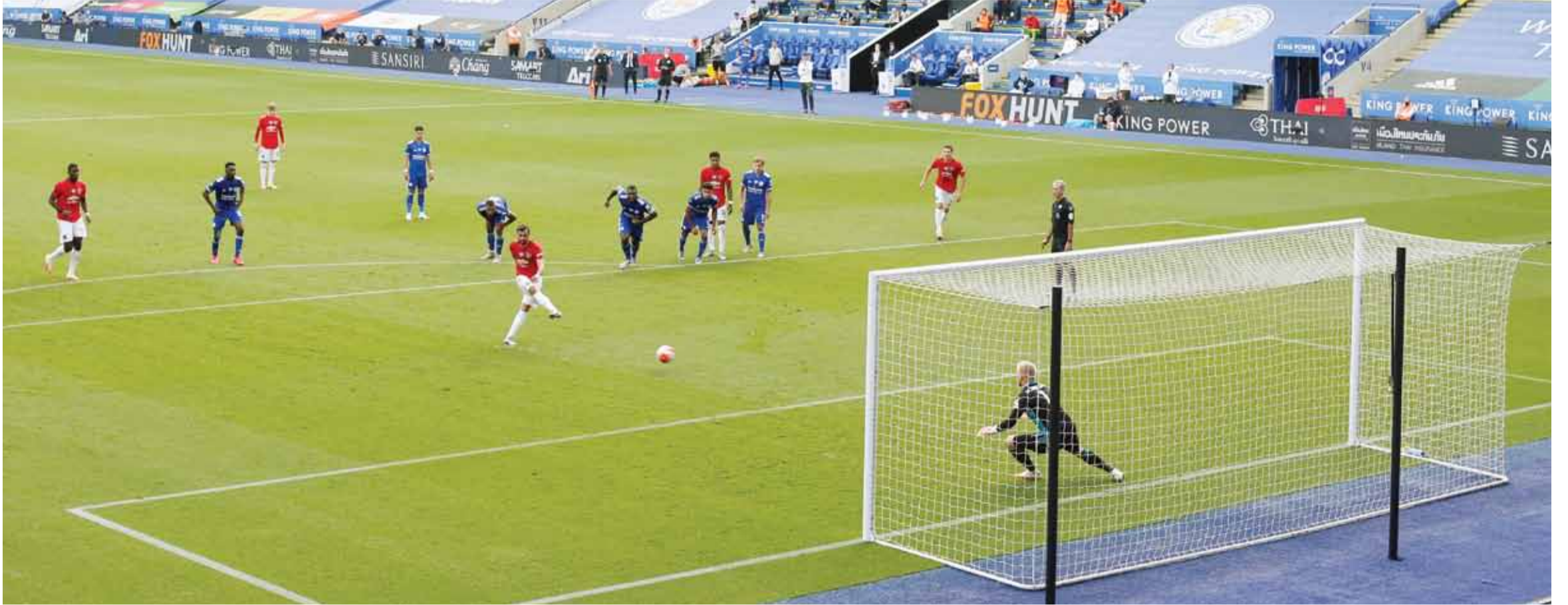
فرنانديز يسجل هدف يونايتد الأول من ركلة جزاء (أ.ف.ب)