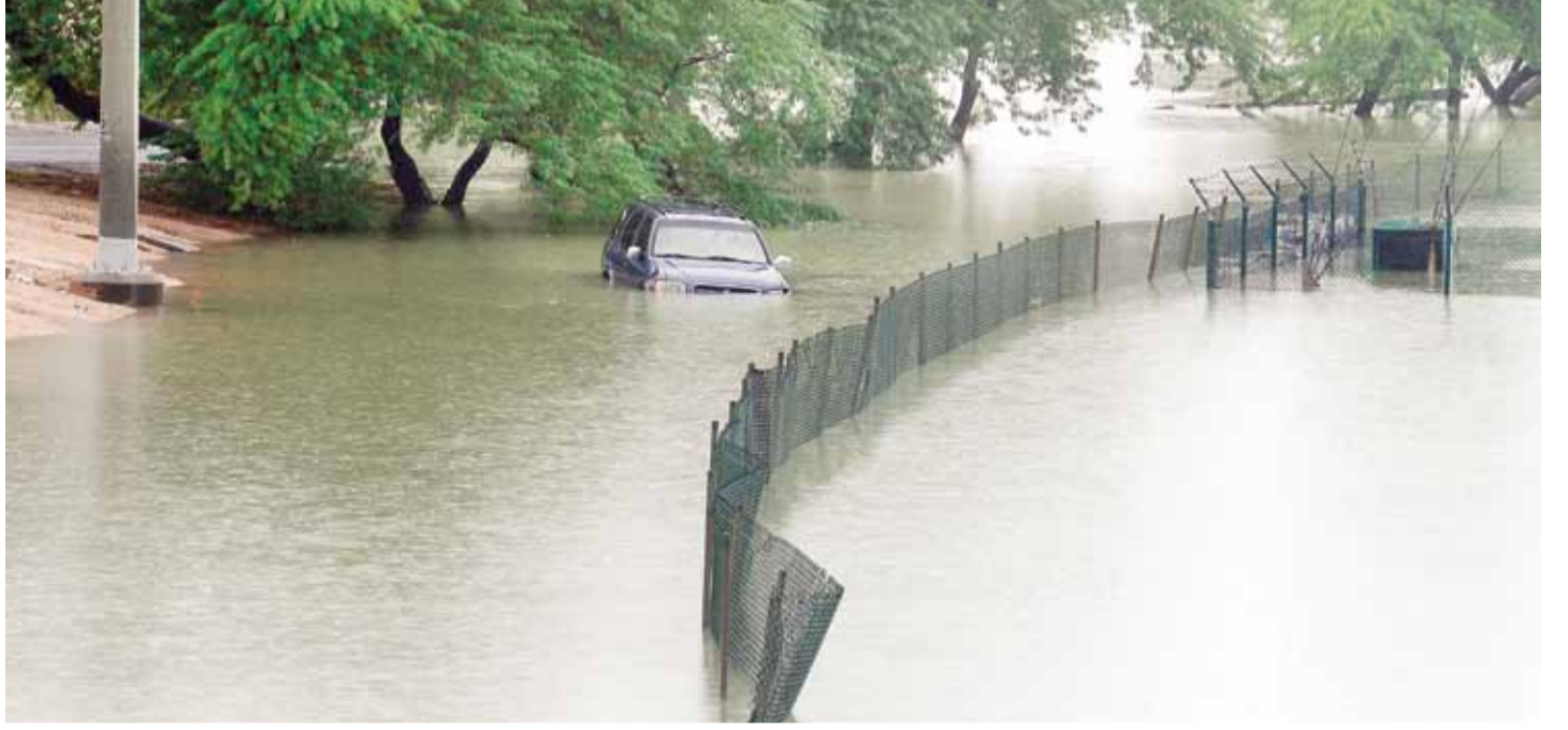
هل سيتركز مشهد الغرق في مدينة صباح الأحمد من جديد؟

■ العصيمي ل القبس: ندفع ضريبة التأخير.. ونخشى تكرار «الغرقة»