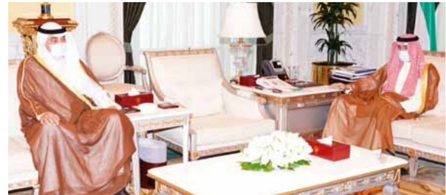
نائب الأمير مستقبلاً الخالد

استقبل سمو نائب الأمير ولي العهد الشيخ نواف الأحمد في قصر السيف صباح أمس، رئيس مجلس الأمة مرزوق الغانم، ورئيس مجلس الوزراء سمو الشيخ صباح الخالد، ونائب رئيس مجلس الوزراء وزير الداخلية وزير الدولة لشؤون مجلس الوزراء انس الصالح. من جهة ثانية، تلقى سمو نائب الأمير ولي العهد الشيخ نواف الأحمد، عصر أمس، اتصالاً هاتفياً من العاهل البحريني الملك حمد بن عيسى، اطمان خلاله على صحة سمو أمير البلاد، متمنياً لسموه دوام الصحة وموفقور العافية. وأعرب سمو نائب الأمير ولي العهد عن بالغ شكره للملك حمد، مقدراً هذا التواصل الأخوي الذي يجسد عمق اواصر العلاقات التاريخية والوطيدة بين البلدين والشعبين الشقيقين، متمنياً له موفور الصحة والعافية.