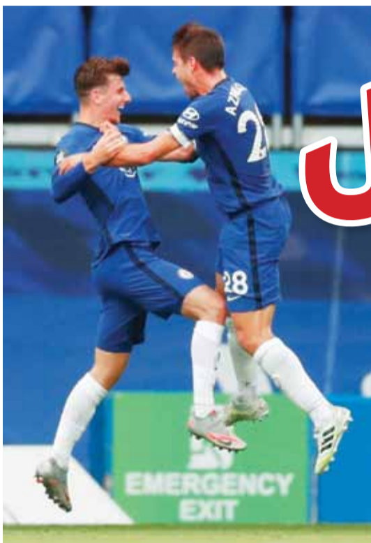
مونت وأربيليكويتا محتفلين بالتأهل (أ.ف.ب)

هام يونايتد، بينما هبط بورنموث رغم فوزه الكبير 3 - 1 على مضيغه إيفرتون، وواتفورد الذي خسر 2 - 3 أمام مضيغه أرسنال. وأسفرت باقي مباريات المرحلة عن فوز ليفربول 3 - 1 على مضيغه نيوكاسل يونايتد، ومانشستر سيتي على ضيفه نورويتش سيتي 5 - 1، وبرايوتون على مضيغه بيرنلي 2 - 1، وساوثامبتون على ضيفه شيفيلد يونايتد 3 - 1