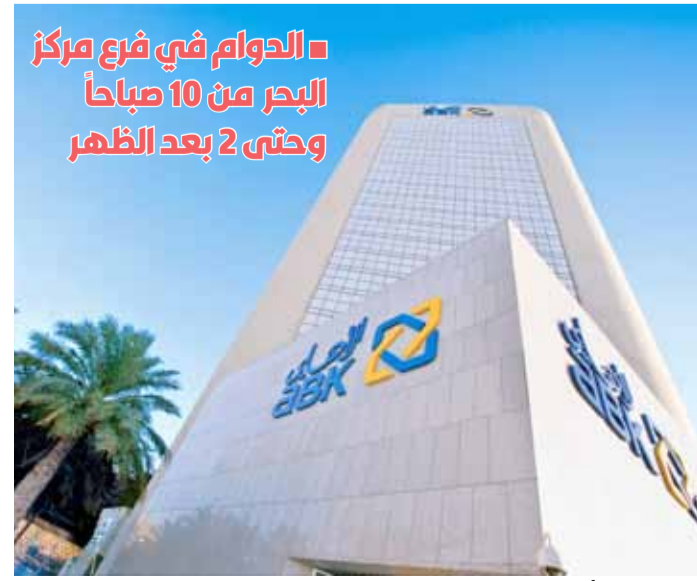
مقر البنك الأهلي الرئيسي في العاصمة

الفروع، فإن البنك يبحث عملاءه مجدداً على الاستمرار في الاستفادة من القنوات الافتراضية المتاحة على مدار الساعة، والمصممة لتلبية كل احتياجاتهم المصرفية. ومن خلال الخدمات المصرفية التي يقدمها البنك الأهلي الكويتي عبر الإنترنت وتطبيقات الهاتف النقال، بإمكان العملاء الاستفادة من الخدمات الرقمية مثل خدمة الدفع ABKPay،