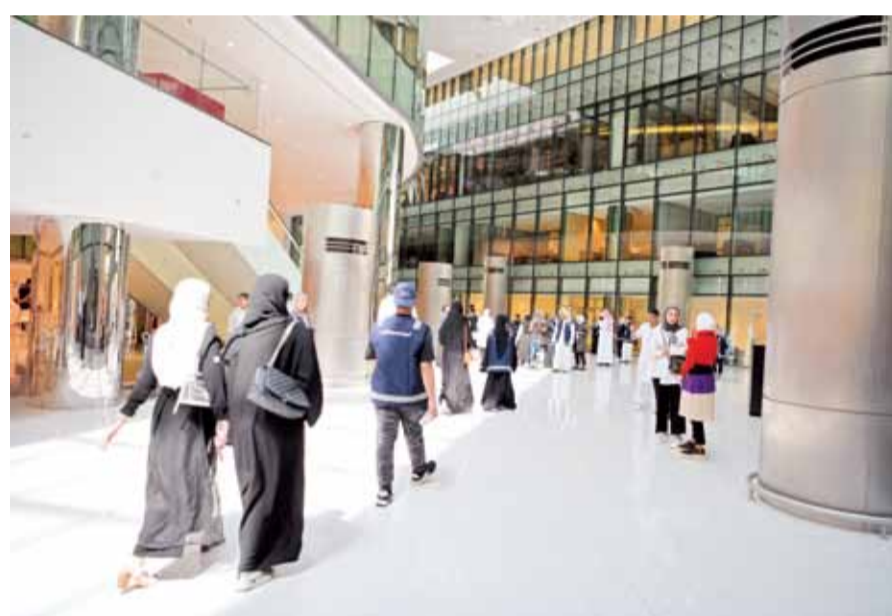
منح فرص تعليمية مميزة لطلبة الجامعة

تأكيداً لما نشرته القبس في 21 الجاري، أكد عميد القبول والتسجيل في جامعة الكويت د. علي المطيري عقد اختبارات القدرات الأكاديمية في مواقع الحرم الجامعي، مؤكداً أن السعة المكانية بمواقع الجامعة تسمح بتقديم الاختبارات، حيث بدأ التسجيل أمس، وستعقد الاختبارات بين 5 و19 سبتمبر. وكشف المطيري، على هامش مؤتمر صحافي عقد أمس عن بعد، أن باب القبول للعام الجامعي 2020-2021 سيفتح أكتوبر المقبل، وأن الإعلان عن خطة القبول سيكون في الأسبوع الأول من استئناف الدراسة في أغسطس، علماً أن استلام طلبات الالتحاق واعتماد القبول سيكون عبر الونلاين.