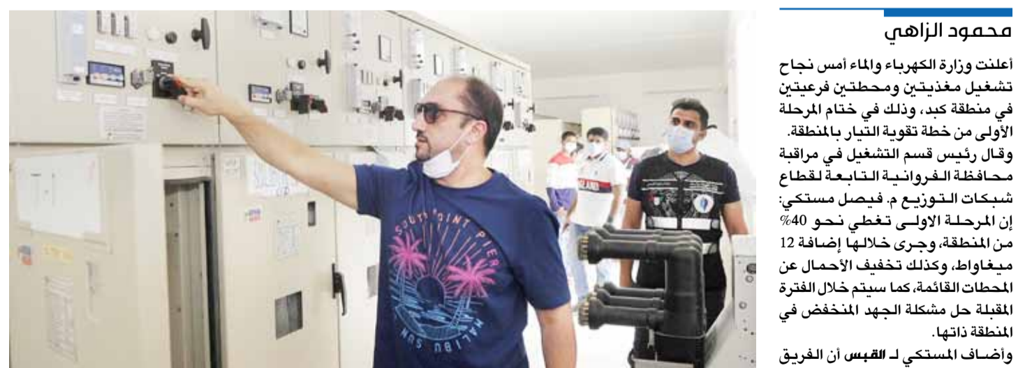
تشغيل محطتي تقوية التيار الكهربائي في كبد

المنطقة، وأن الحملة ستستمر لمسح كامل الجواخير الواقعة على امتداد 13 قطعة، ولن تكون هناك أي استثناءات، داعياً أصحاب الجواخير إلى التعاون لتعديل وضع الشبكة، بعدما تسببت الأحمال الزائدة الناجمة عن المخالفات في قطع التيار الكهربائي أكثر من مرة عن المنطقة.