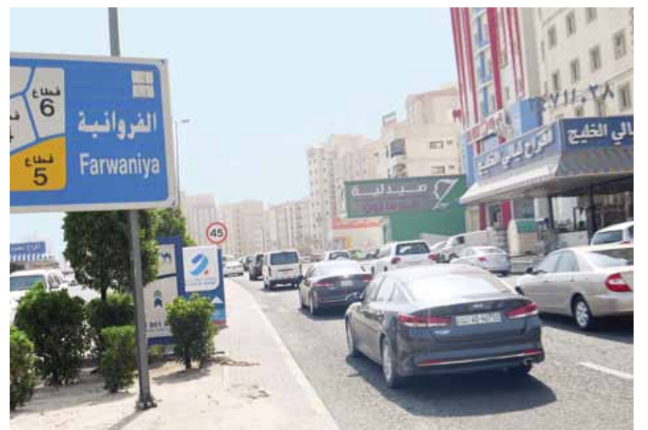
الحركة عادت إلى الشوارع