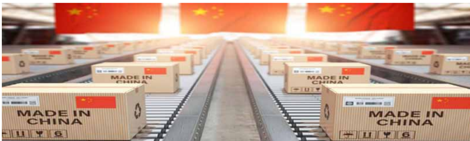
صناعة التسوق عبر الإنترنت في الصين وصلت إيراداتها إلى 1.8 تريليون دولار

تعد الصين قوة اقتصادية كبرى، فهي ثاني أكبر اقتصاد في العالم، ورغم تأثر اقتصادها في بداية العام بسبب جائحة فيروس كورونا المستجد، فإن التقارير الاقتصادية التي صدرت مؤخراً تشير إلى تعافي اقتصادها في الربع الثاني من 2020. وسجل الاقتصاد الصيني نمواً بنسبة 3.2% خلال الفترة من أبريل وحتى يونيو مقارنة بالفترة نفسها خلال العام الماضي، وذلك بعد مرور الاقتصاد الصيني في بداية العام بأسوأ ثلاثة أشهر منذ عقود. ويعتمد الاقتصاد الصيني على صناعات متنوعة، وقد حلل الخبراء في شركة IBISWorld المتخصصة في أبحاث السوق قاعدة بيانات تضم 280 صناعة في الصين، وتوصلوا إلى أكبر الصناعات من حيث الإيرادات بها. وفيما يلي أكبر الصناعات من حيث الإيرادات في الصين في 2020: