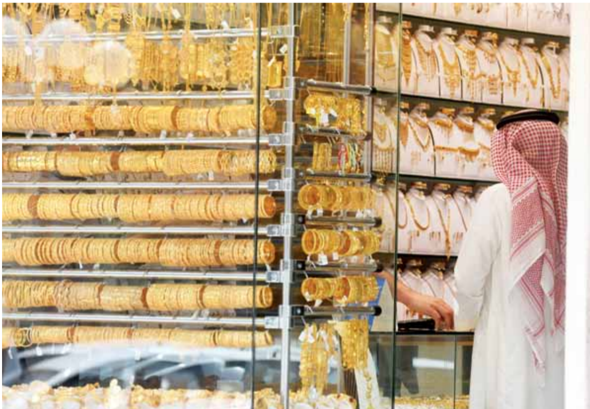
محال الذهب استعادت زخفها