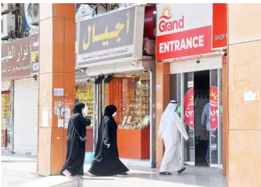
مواطنون نحو التسوق في أحد المجمعات

وأشار سكان منطقة الفروانية لـ القبس إلى أن أبرز التحديات الآن هي العودة إلى العمل حيث إن كثيراً منهم فقدوا الوظائف ومنعت عنهم الرواتب منذ إغلاق المنطقة، ليصبح شغلهم الشاغل الآن تسديد الإيجارات المتركمة والفواتير والإقساط عن شهرين ماضيين.